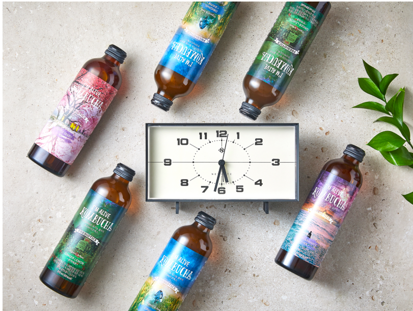
506시간 자연발효 아임얼라이브 콤부차

살아가면서 많은 바람이 있지만 그중에서도 제일은 '건강' 아닐까요? 사랑하는 가족, 연인, 친구 그리고 나를 위해 건강을 위한 진심을 담은 아임얼라이브 콤부차의 그 첫 여정에 여러분을 초대합니다 :)